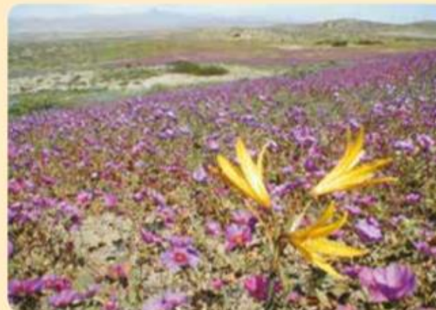
Desierto florido, Región de Atacama.