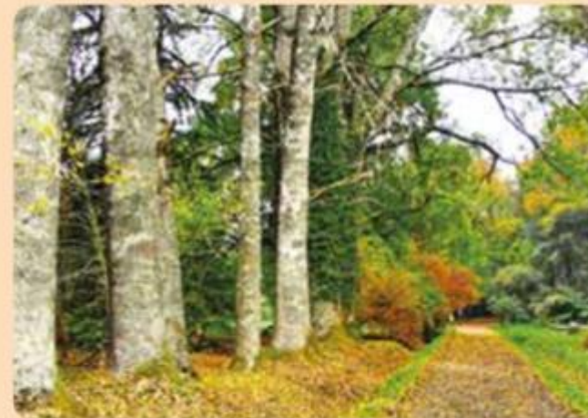
Jardín Botánico Isla Teja, Valdivia