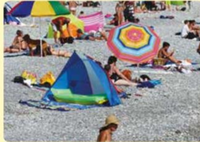
Frutillar, Región de Los Lagos.